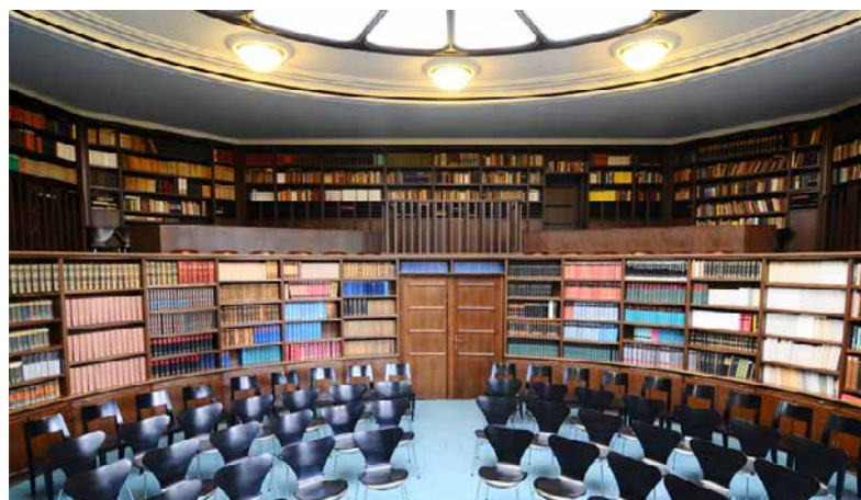
Lesesaal im Warburg-Haus

– Wissenschaftspreissträger der Aby-Warburg-Stiftung 2024 / Veranstalter: Aby-Warburg-Stiftung